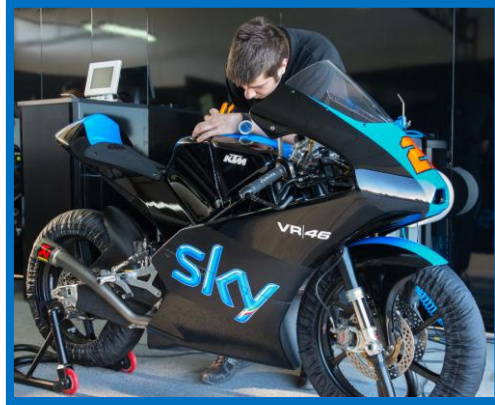
La moto ufficiale dello Sky Racing Team